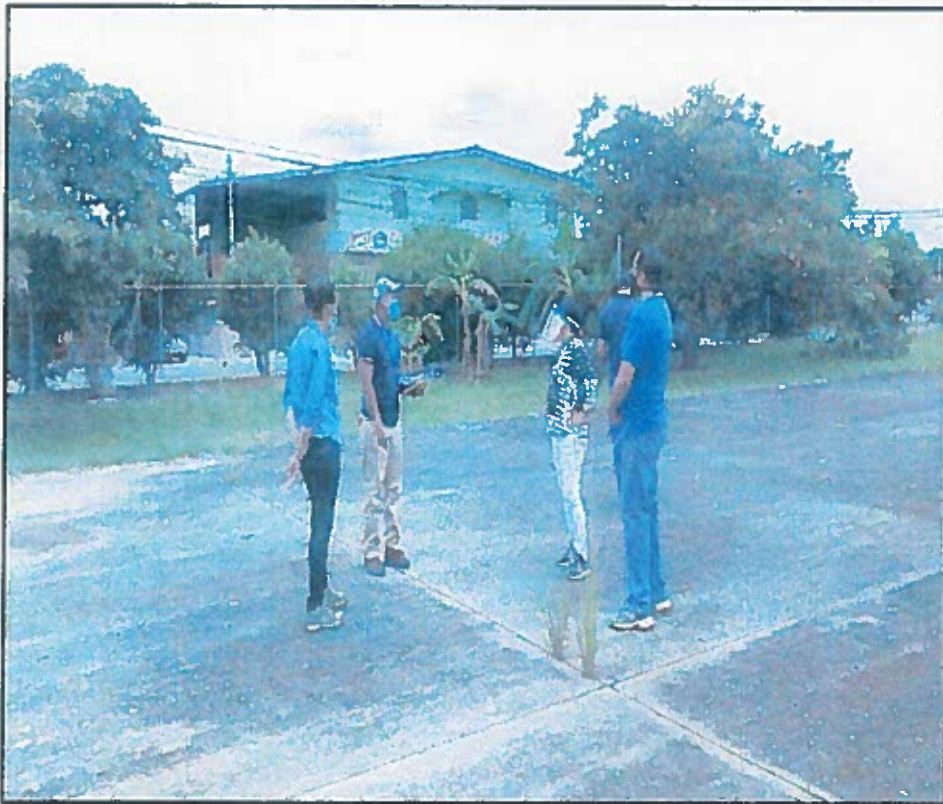
LATERAL DE PISO HACIA LA CALLE