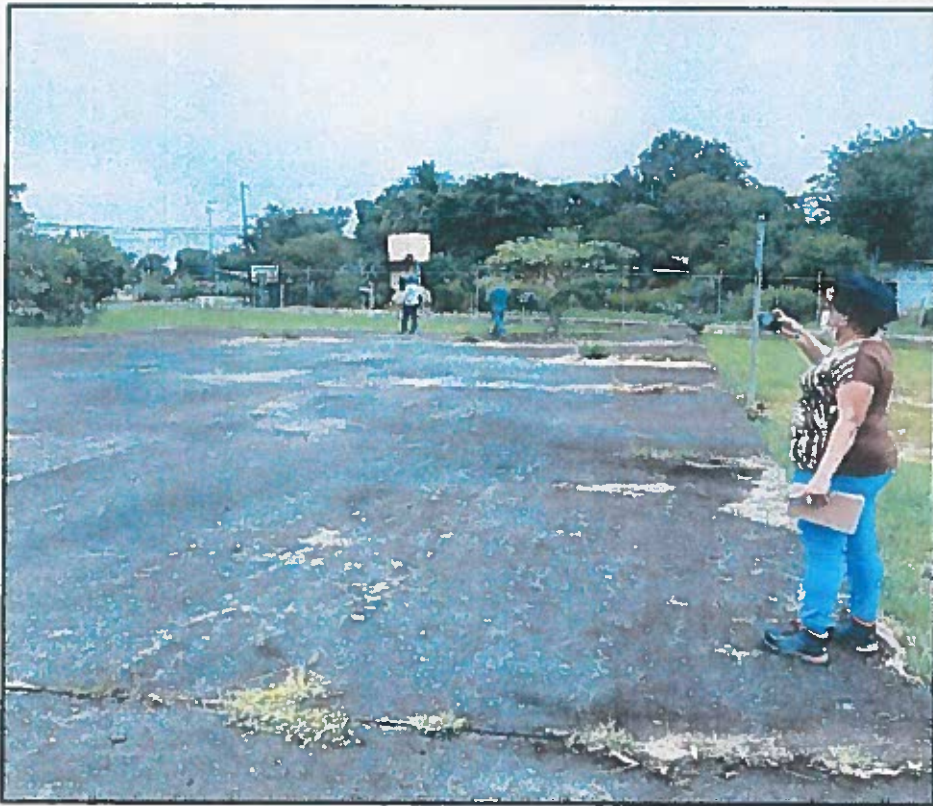
PISO EXISTENTE(cancha vieja malas condiciones)