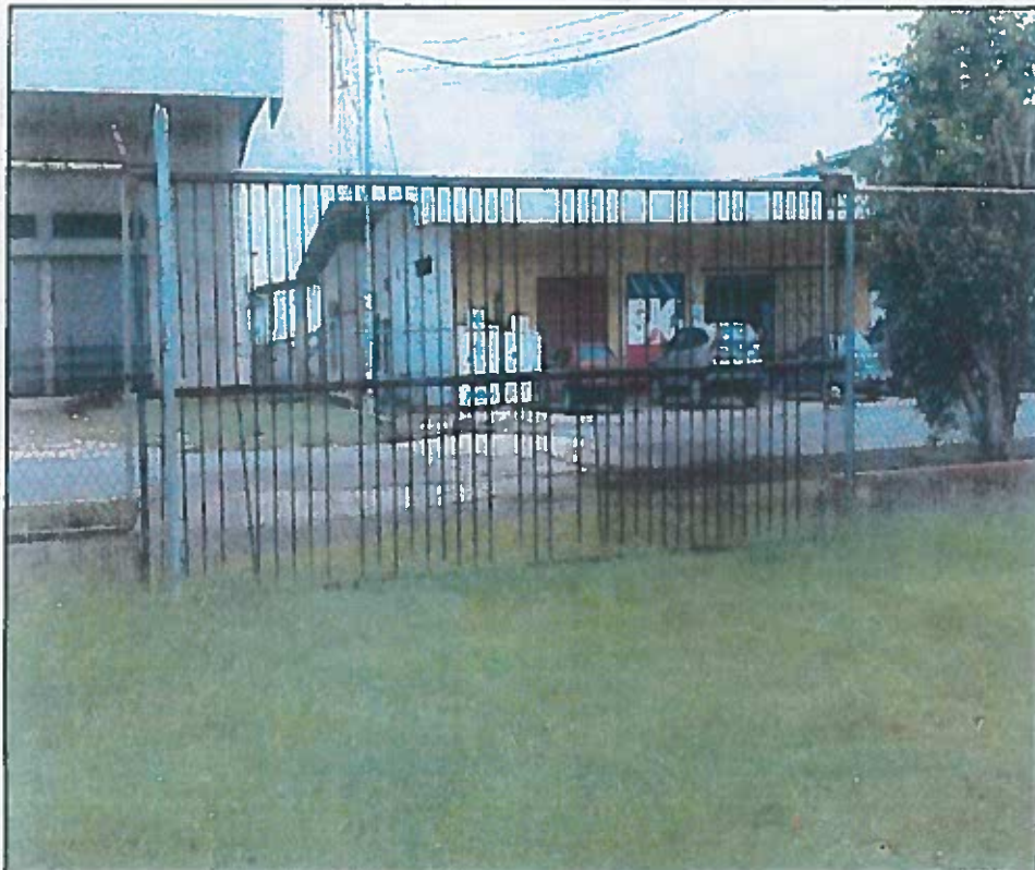
PUERTA DE ACCESO