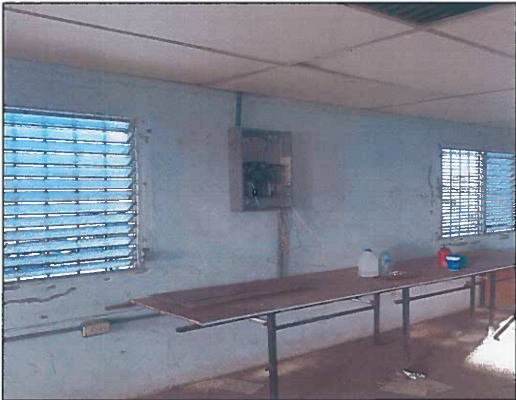
REEMPLAZAR SISTEMEMA ELECTRICO, CIELO RASO, COLOCAR BALDOSAS