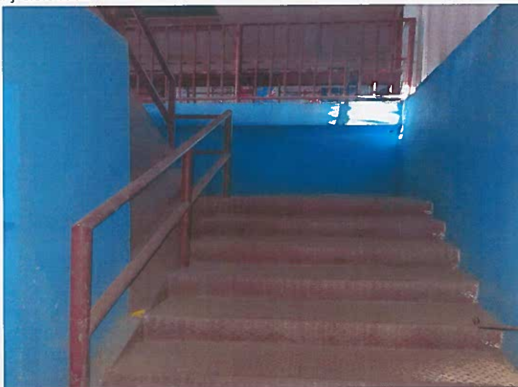
PINTAR ESCALERA METALICA(entrada parte posterior)