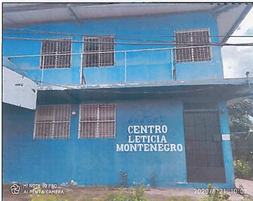
FACHA FRONTAL EXTREMO DERECHO (pintar parte superior)