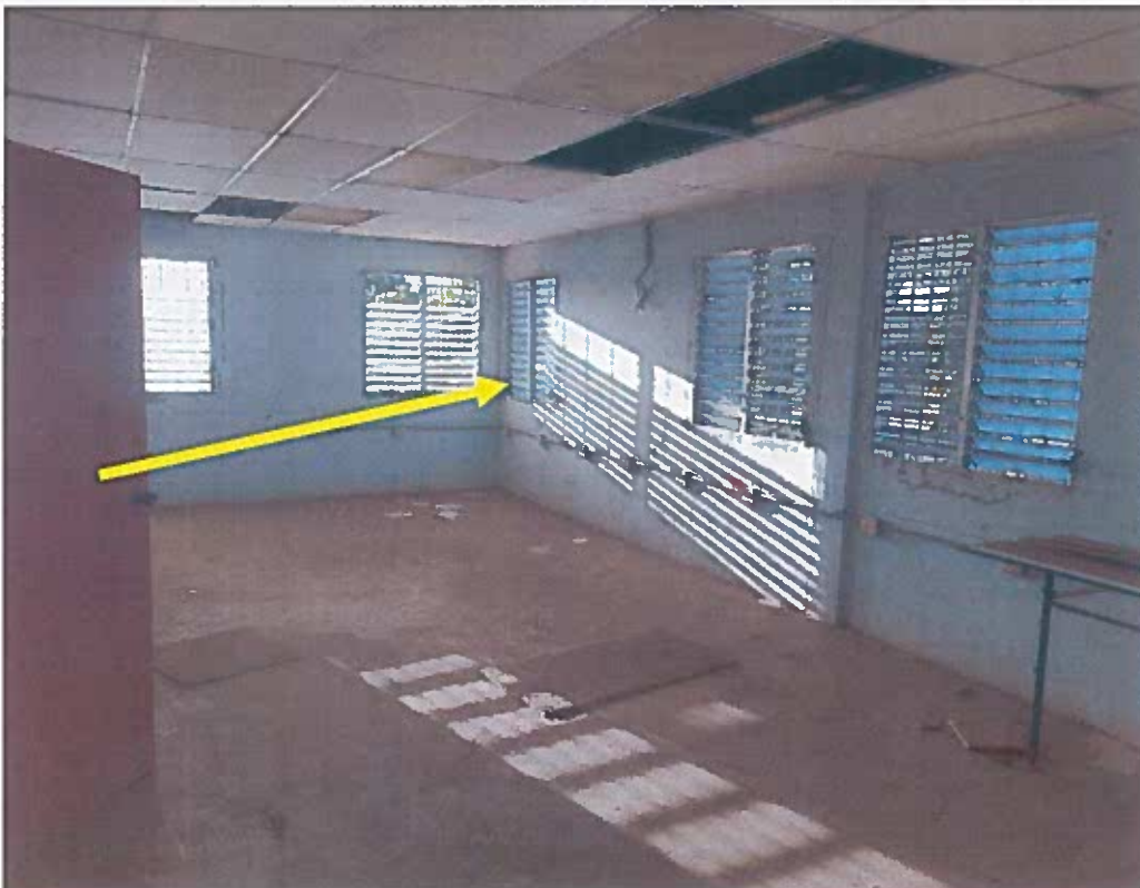
COLOCAR PUERTA DE ENTRADA PRINCIPAL A PRIMER ALTO