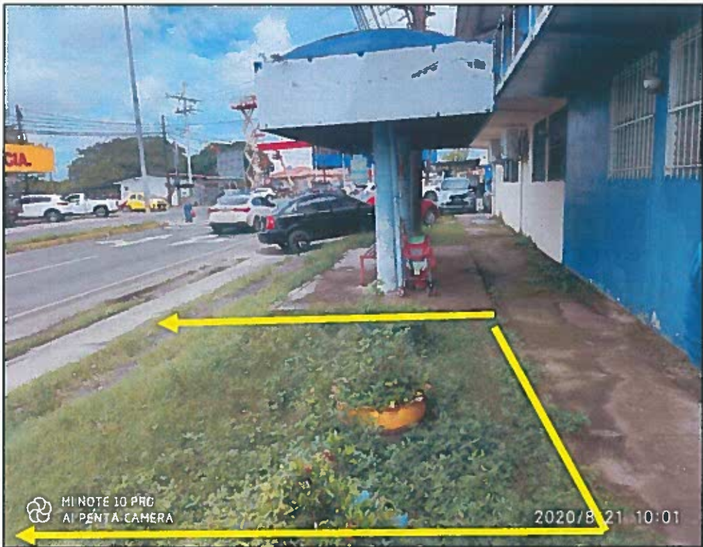
CONSTRUCCION AREA DE ESTACIONAMIENTO