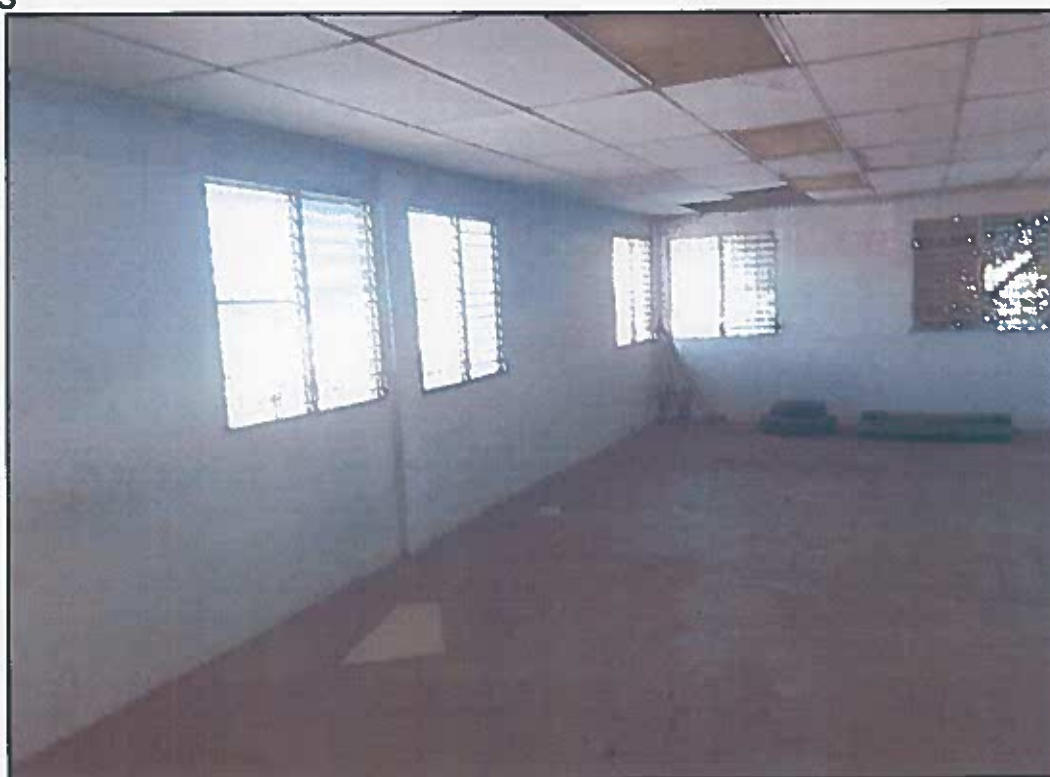
ESQUINA FRONTAL IZQUIERDA(rehubicar ventanas, colocar baldosas, reemplazar electricida y cielo raso)