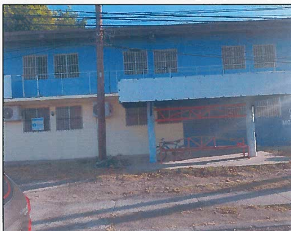
FACHADA FRONTAL (pintar primer alto)