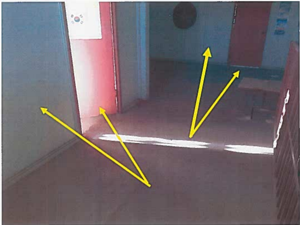
PAREDES DE PLAYWOOD Y PUERTAS A REEMPLAZAR