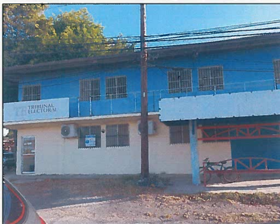
FACHADA FRONTAL EXTREMO IZQUIERDO (pintar primer alto)