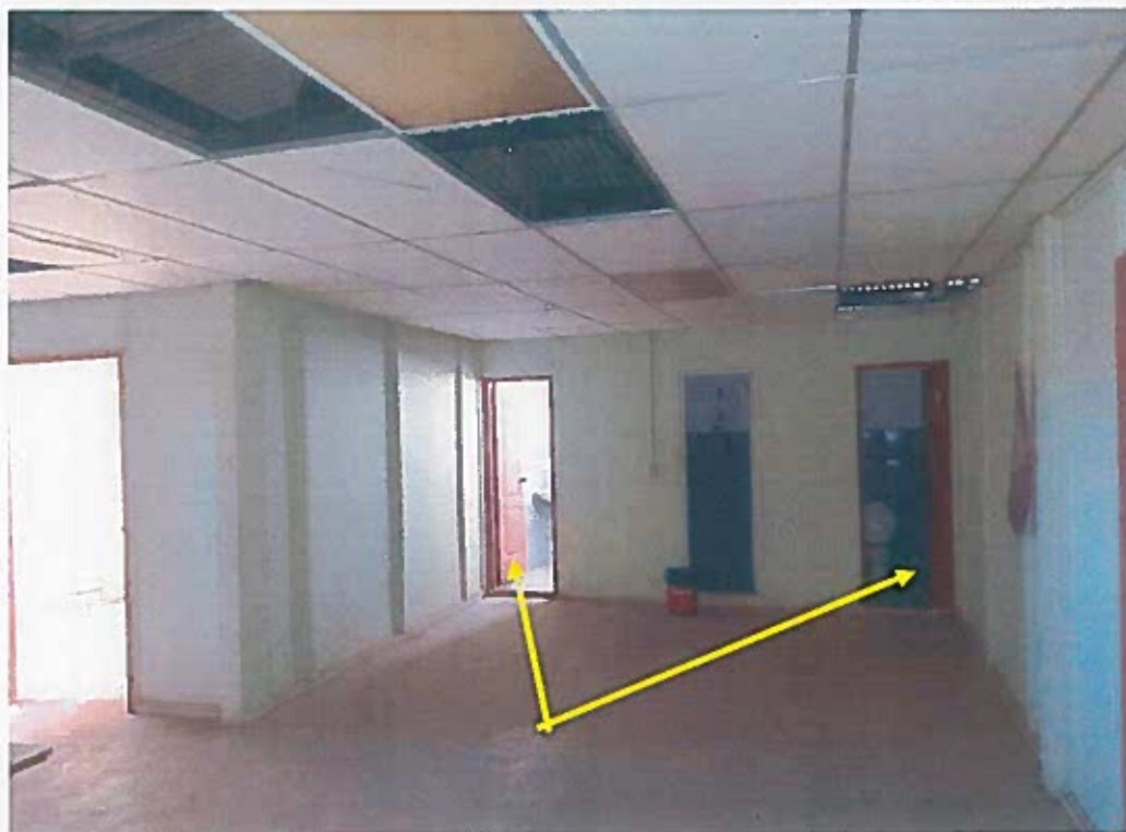
BAÑOS: LIMPIAR AZULEJOS, COLOCAR BALDOSAS, CAMBIAR CIELO RASO Y PUERTAS