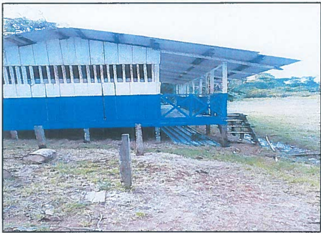
ELEVACION LATERAL IZQUIERDA