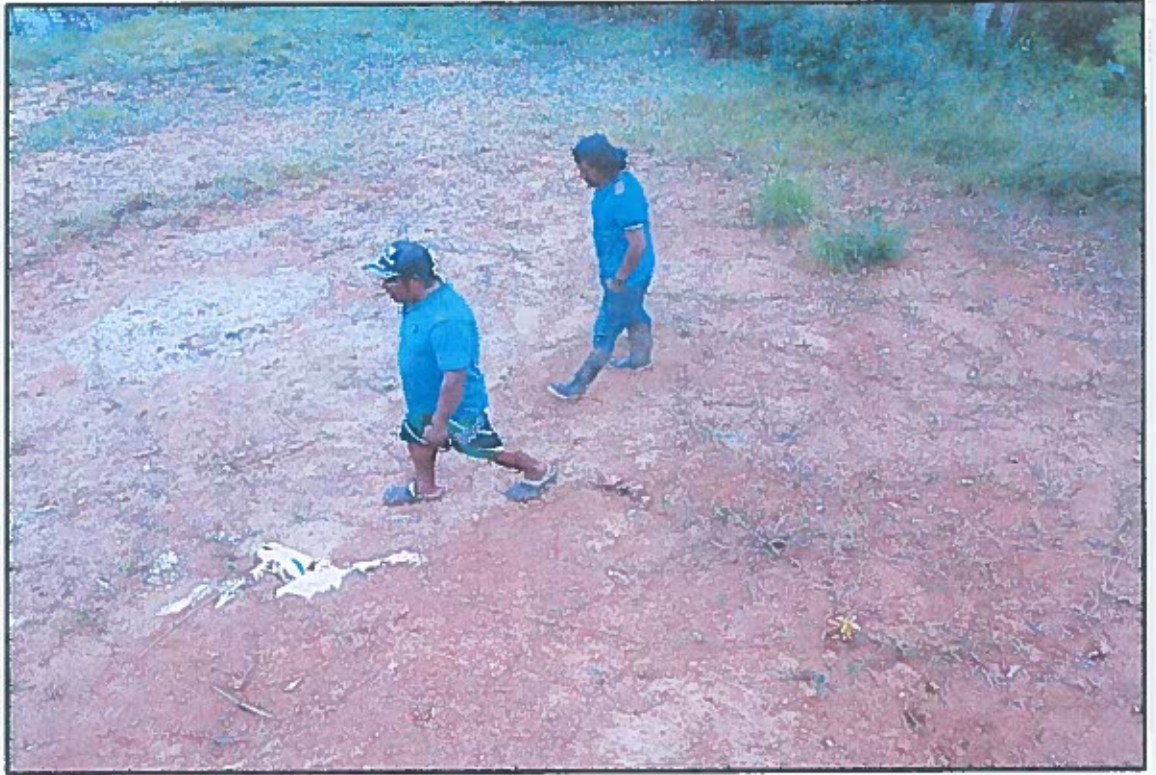
TERRENO FRENTE A LA ESCUELA