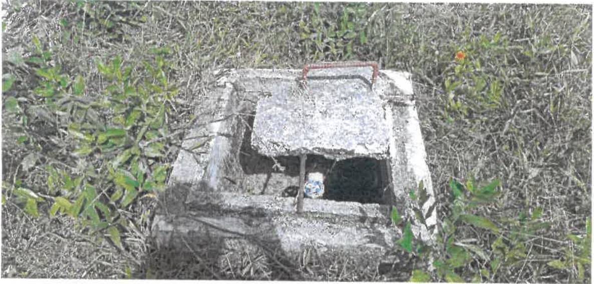
Cajas de Llaves existente