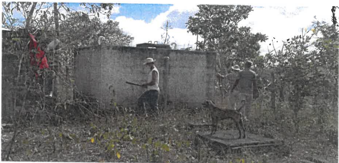
Construir cerca perimetral