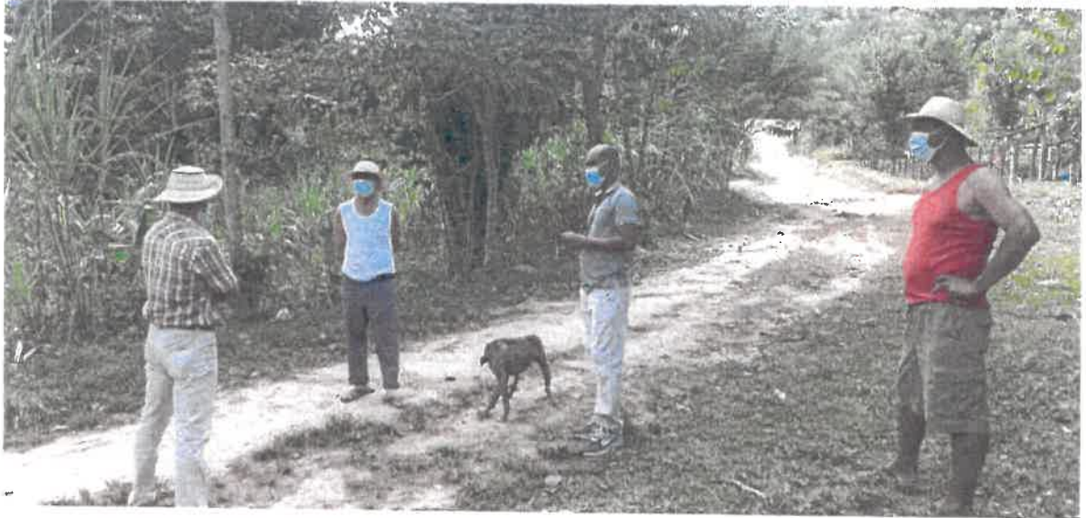
Área a realizar perforación y construir caseta