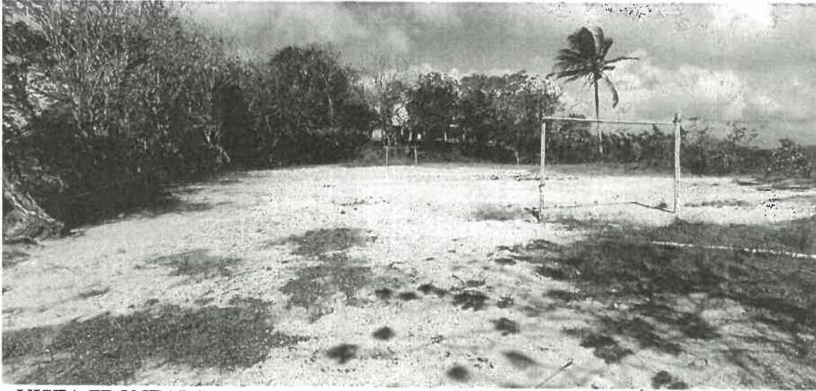
VISTA FRONTAL DE SITIO EXISTENTE PARA CONSTRUCCIÓN DE CANCHA

ESCUELA BILINGÜE DE MEMBRILLO EN LA COMUNIDAD HOMÓNIMA, CORREGIMIENTO DE PAJONAL, DISTRITO DE PENONOMÉ, PROVINCIA DE COCLÉ