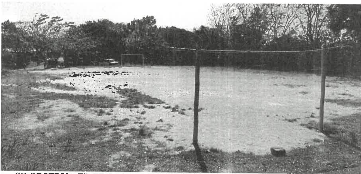
SE OBSERVA EL TERRENO CASI EN SU TOTALIDAD, PROPIEDAD DE LA ESCUELA