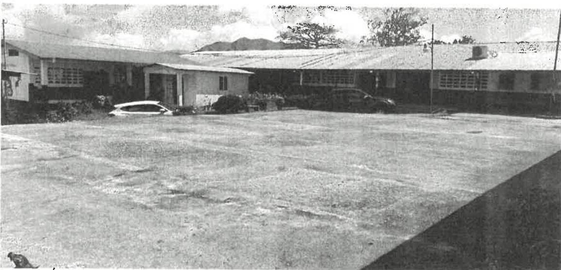
TAMBIÉN SE UTILIZA ESTA PLAZOLETA UBICADA DENTRO DE LA ESCUELA, LA MISMA PRESENTA DETERIORO EN SU PISO Y SIN TECHO